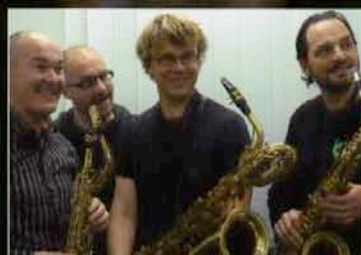
ARTE QUARTETT KOMPLEXE SAXPARTITUREN