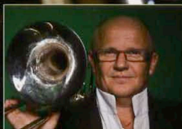
CHRISTIAN LINDBERG NORDIC CHAMBER ORCHESTRAN